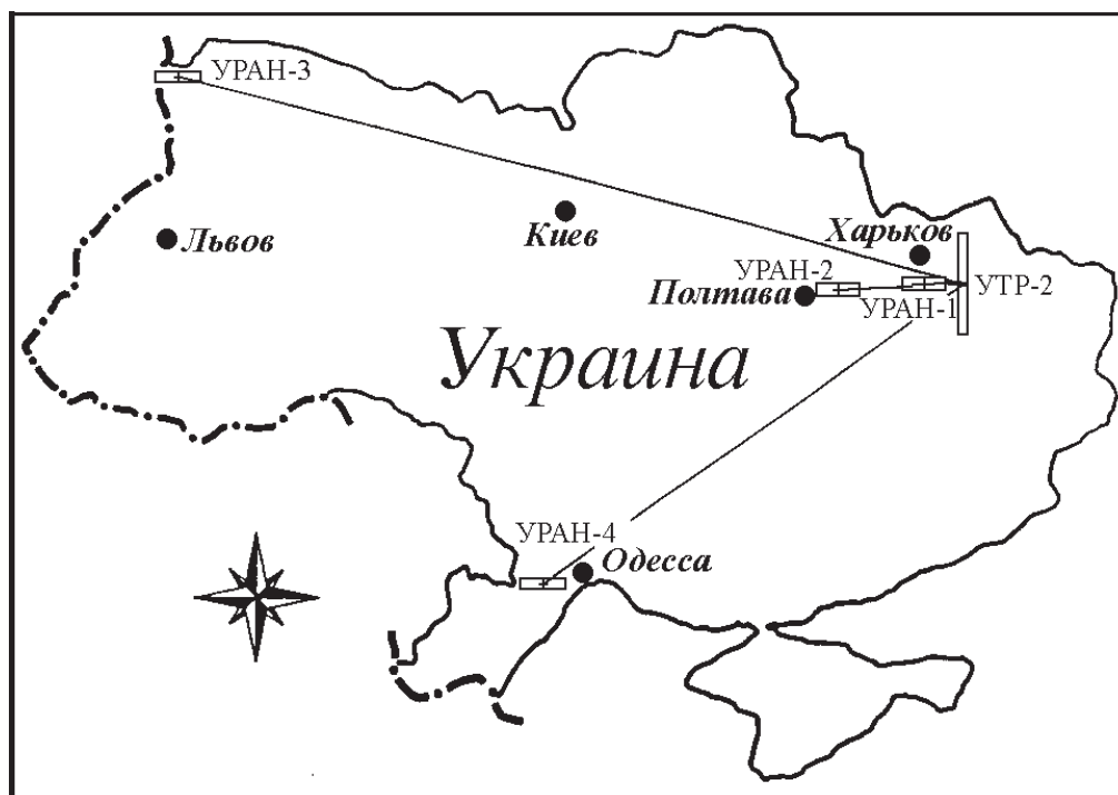
Рис. 1. Размещение антенн системы УРАН на территории Украины

Разрешение интерферометра, как известно, не зависит от его антенн и определяется только величиной базы D и ее ориентацией в пространстве. Характеристики антенн задают чувствительность радиоинтерферометрического приема, пропорци-