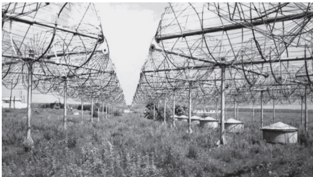
Рис. 2. Фотография антенны УРАН-1

Измерения на интерферометрах УРАН из-за существенного влияния ионосферы и плазмы солнечной сверхкороны проводились, как правило, в осенний, зимний и весенний периоды в ночное время суток при больших элонгациях (углах между направлением на радиисточник и центр Солнца). Измерения велись в диапазоне от 25 до 16.7 МГц одновременно на двух частотах [3-6], чаще всего на 25 и 20 МГц. При наблюдении за радиисточником лучи радиотелескопов переключались дискретно с интервалом 20 мин, в пределах которого велись записи высокочастотных сигналов и определялись модули функции видимости при разных часовых углах источника T_0 в пределах обычно не менее \pm 2 часов относительно момента кульминации радиисточника – пересечения объектом вертикальной плоскости, проходящей через меридиан на юге. Радиointерферометр с малой базой (УРАН-1) работал в основном в режиме реального времени, т. е. интерференционные сигналы наблю-